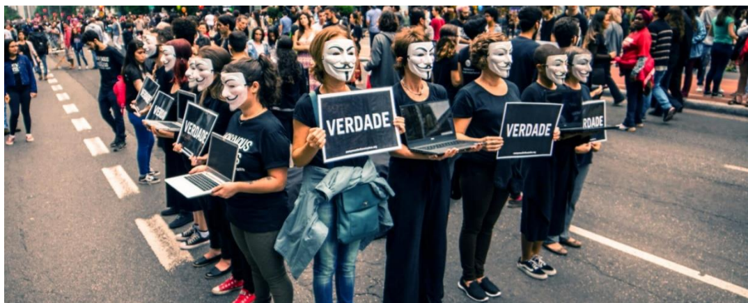
Imagem 1. Imagem de ativistas do grupo “ Anonymous for The Voiceless ” segurando cartazes com a palavra “verdade”. Seu ativismo consiste em mostrar imagens de animais sendo explorados e torturados em espaços públicos para chocar os transeuntes 42 .

Em segundo lugar, porque o Veganismo branco, burguês, cis-hétero, masculinista e classista não dialogará com as populações subalternizadas da mesma forma que o feminismo europeu, branco, burguês, hétero e ocidental não o faz com as mulheres subalternizadas (crítica de Espinosa-Miñoso 43 ). E, quando o Veganismo não dialoga com essas pessoas, o sistema estrutural interconectado de opressões 44 se fortalece e todos perdem, inclusive animais não humanos, que são o foco da luta antiespecista. Isto porque a pauta da opressão animal seria cada vez mais afastada pelas minorias políticas, assim como continuaria havendo um fortalecimento da estrutura Capitalista que apenas reforça e mantém a lógica especista – e opressiva. Sem um comprometimento com uma postura ético-política, é isto o que continuará acontecendo.